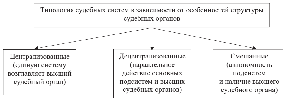
Рис. 3. Типология судебных систем в зависимости от особенностей структуры судебных органов

Наряду с отличительными особенностями судебных систем по закреплению норм в источниках права в рамках различных моделей правосудия, можно классифицировать судебные системы и по различиям в структуре (рис. 3).