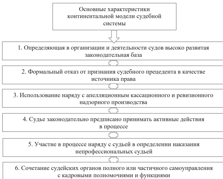
Рис. 1. Основные характеристики континентальной модели судебной системы [3]