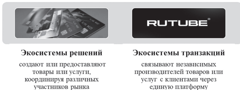
Рис. 2. Типы экосистем и их примеры

В последние годы наблюдается тенденция трансформации бизнес-процессов многих крупных компаний и их стремление перейти в формат бизнес-экосистем. Среди российских компаний есть яркие примеры успешного прохождения цифровой трансформации (Сбер, МТС, Яндекс). В настоящее время для этого есть масса возможностей и благоприятные условия. Хотя правовое регулирование бизнес-экосистем в настоящий момент развито слабо. При этом, на наш взгляд, создание и эффективное функционирование бизнес-экосистемы невозможны без сильной законодательной базы.